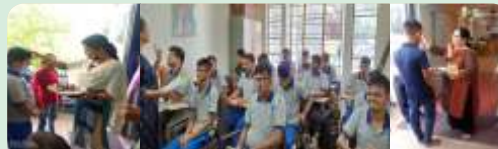
ATCB SCHOOL- BPA CAMPUS