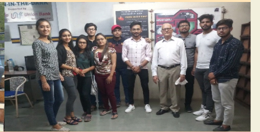
આર. કે. ઈન્સ્ટિટ્યુટ વિદ્યાર્થીઓ