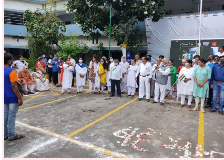
અંધજન મંડળ ખાતે પ્રજાસત્તાક દિવસ ઉજવાયો