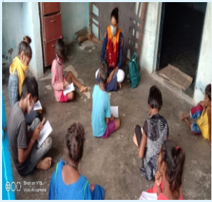
આંગણવાડીમાં પ્રવૃત્તિમય ભૂલકાઓ સાથે શિક્ષકશ્રી