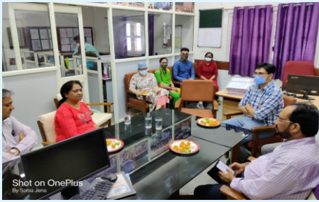
Shot on OnePlus

નેત્ર નિદાનની તમામ અઘતન સુવિધાઓ માટે પ્રસિધ્ધ બારેજા આંખની હોસ્પિટલની મુલાકાત ગુજરાત સરકારના સામાજિક ન્યાય અને અધિકારીતા