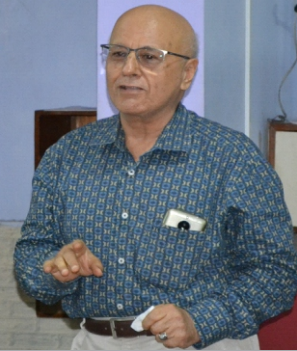
સંસ્થાના સ્વંયસેવક શ્રી ખજાનચી