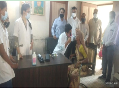
રામપુર પંચાયત ખાતે