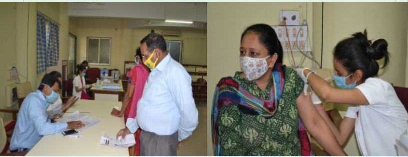
ડ્રાઈવ થ્રુ વેક્સીનેશન કાર્યક્રમ

અને બીજા તબક્કાનો દ્વિતીય રોજ પણ કેમ્પસમાં તારીખ ૧૨ સપ્ટેમ્બર -૨૦૨૧ ના રોજ સુનિશ્ચિત રીતે કરવામાં આવ્યો હતો. આ કાર્યક્રમમાં વેક્સીનેશન ટીમ, બીપીએ સ્ટાફ ગણ, સ્વયં સેવકો, મેડીકલ સ્ટાફ ફરજ બજાવી રહ્યા હતા આ સમયે દિવ્યાંગજનોએ રસીકરણથી સ્વ-બચાવની વાત દોહરાવતા કહ્યું હતું કે સામાન્યજનોએ પણ રસી લેવી જોઈએ તેઓ જનજાગૃતિનો સંદેશ આપ્યો હતો. આ સામૂહિકતા રસીકરણથી વિશ્વ રેકોર્ડ નોંધ એક સાથે દિવ્યાંગજનોનાં રસીકરણની થઈ હતી.