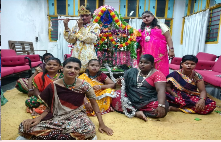
નાઝ સેન્ટર ખાતે જન્માષ્ટમીની ઉજવણી