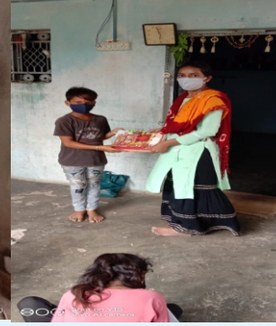
શિક્ષકોની શેરી મુલાકાત